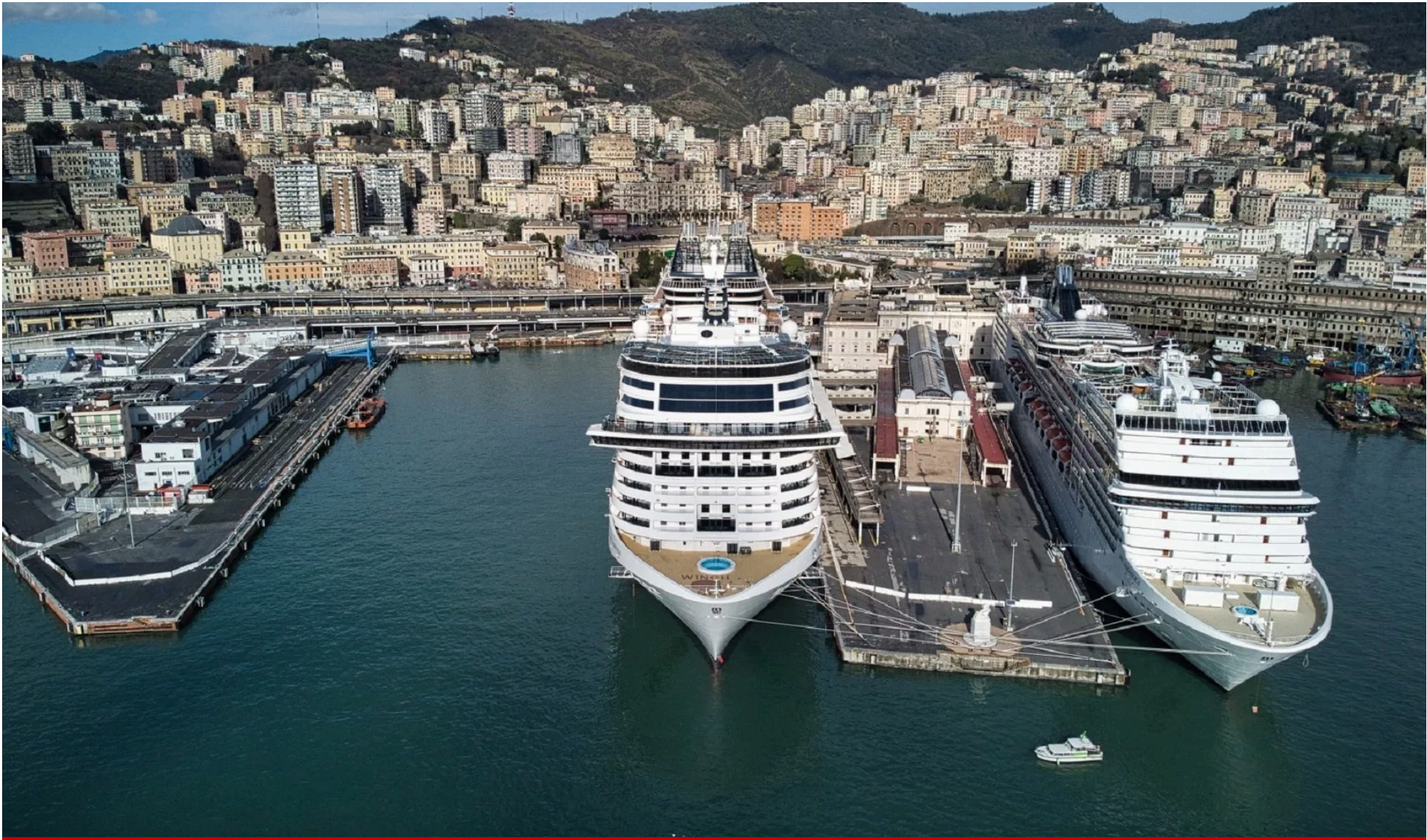
Navi al Terminal crociere e traghetti di Genova